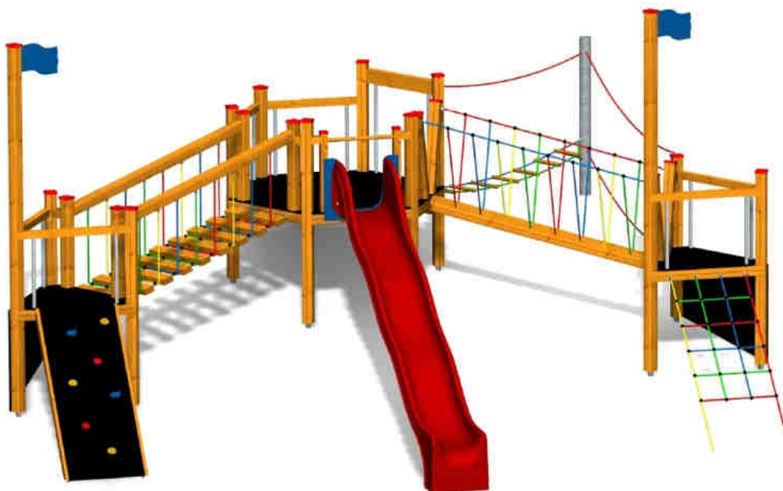
ilustrativní vyobrazení (provedení s lazurou)