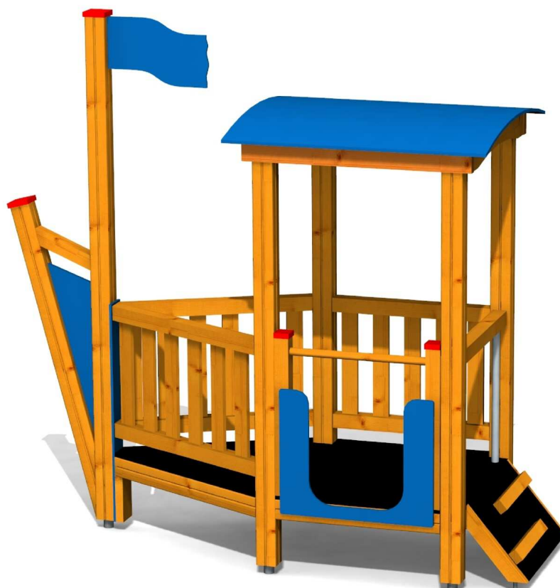
ilustrativní vyobrazení (provedení s lazurou)