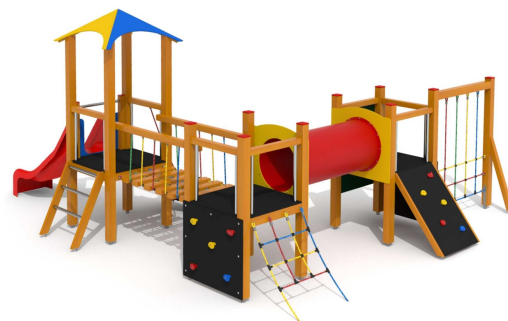
ilustrativní vyobrazení (porovedení s lazurou)

Zařízení je certifikováno a splňuje veškerá kritéria stanovená platnými normami a předpisy EU a ČR (ČSN EN 1176).